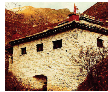
The "Temple Of Miraculous Fire" at Muktinath, Nepal. Photo by Ken Street (Nov. 1979).

[For more on this subject, please read our tract The Temple Of Miraculous Fire .]